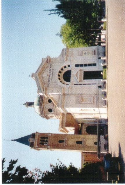
Chiesa di S. Antonio

“museo all'aperto” e si propone di essere una guida alla visita delle testimonianze più significative dell'architettura del periodo fascista, giunte a noi pressoché inalterate attraverso un itinerario segnalato da pannelli esplicativi elaborati con testi ed immagini.