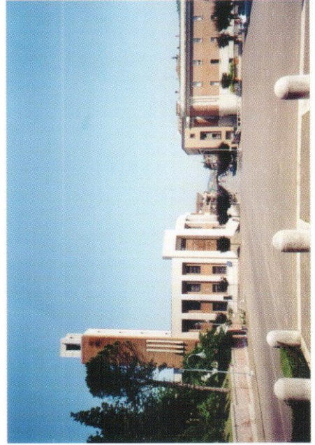
Veduta prospettica del viale principale

Il Museo Urbano di Predappio ha le caratteristiche di un