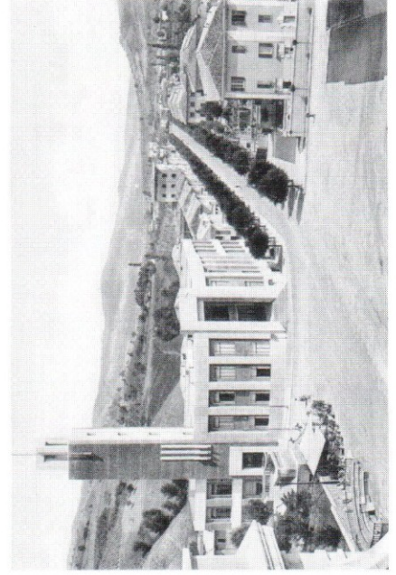
Immagine anni '30 di Piazza S. Antonio

Strutturata sul rapporto fra la semplicità della casa natale del duce e la fondazione del centro abitato, l'invenzione del paese di Mussolini si poneva come obiettivo quello di tracciare e saldare il legame fra le origini popolari del