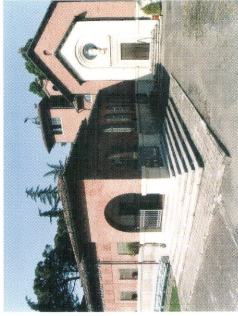
Asilo e Oratorio di S. Rosa

L'iniziativa di costituire il Museo Urbano di Predappio, un primo importante passo per la valorizzazione e il recupero di questo patrimonio urbanistico e architetto-