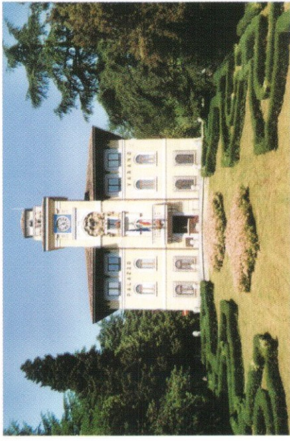
Palazzo Varano, attuale sede Comunale

Capo del Governo e la modernità impressa dal regime attraverso le opere pubbliche.